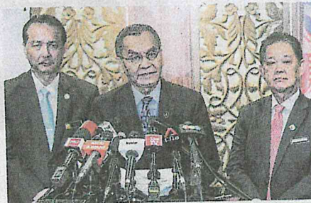
DR Dzulkefly (tengah) ketika sidang media selepas Mesyuarat Khas dan Sesi Taldimat Berkaitan Isu Koronavirus Baharu di Putrajaya, semalam.

"Semua kes positif koronavirus baharu ini adalah warganegara China. Sehingga jam 12 tengah hari 3 Februari 2020, jumlah kumulatif kes PUI bagi koronavirus baharu seramai 192 orang apabila 105 adalah