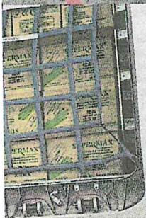
SARUNG tangan yang dibawa sebagai sumbangan kepada kerajaan China.

Namun beliau enggan mendedahkan lokasi pusat pemantauan untuk kuarantin itu di bawah tanggungjawab Agensi Pengurusan Bencana (Nadma).