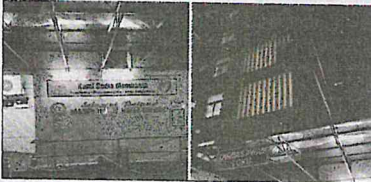
Tangkap layar kenyataan Guna Vimala di Facebooknya.

HOSPITAL TUANKU JAAFAR SEREMBAN. Tegok keadaan tandas kecemasan hospital paip air pecah lagi setiap tandas tak de paip untuk pergi jaban tak de macam mana org hak cuci hee... lah pintu tandas semua rosak tak de lock. Semalam i nak guna tandas tapi i tgg semua rosak i minta tolong dkt security guard nak pergi tandas sebelah dkt dgn pintu masuk ke wad itu yang bawah itu guard itu ckp tandas itu dkt bawah untuk staff sahaja dia guna tapi i pergi tgg tandas awam pula knp guard itu ckp macam itu pula. Guard malam itu ckp macam itu lagi dia nak macam marah dgn saya. I pergi megaduh dkt guard dkt depan sekli macam pondok guard org melayu dia ckp boleh encik pergi tandas itu lps itu dia ckp dgn guard yg jahat tadi tak bagi i guna tandas itu... Lps itu baru dia bagi i guna tandas itu tandas itu pula bersih sangat. Knp guard hospital ini buat macam itu pula. baik sikit ckp dgn org jagan nak tunjuk muka pula nak kurang ajar dgn org awam tolong lah baik sikit peregai itu tolong bersopan sikit hormat org sikit tak baik kita semua manusia bukan haiwan..... Kita semua 1 Malaysia..... Ok tq kalau i ada ckp salah tolong minta maaf ye... Pihak kerajaan tolong ambil tindakan keadaan Hospital Tuanku Jaafar Seremban.