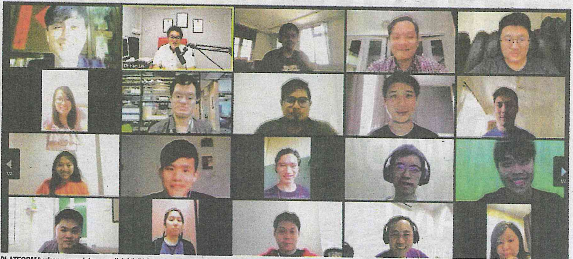
PLATFORM berkenaan sudah menarik lebih 700 sukarelawan daripada pelbagai bidang antaranya saintis data dan doktor perubatan untuk melakukan analisis data.

Lebih 700 sukarelawan pelbagai bidang sertai CoronaTracker analisis data virus koronavirus baharu