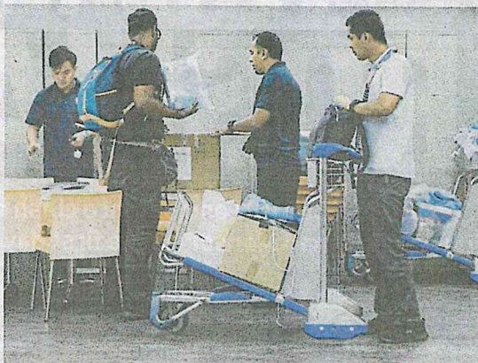
Mission officers preparing for the trip to Wuhan, China, at klia2, Sepang, yesterday.

showed that operations at the ADU are in full swing.