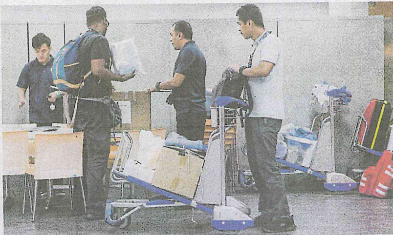
Sebahagian daripada pasukan Perubatan Kecemasan dan Perkhidmatan Trauma (EMTS) Kementerian Kesihatan membawa peralatan untuk berangkat ke Wuhan semalam.

mua 167 penumpang iaitu 141 yang dibawa pulang, 12 kru, lapan petugas misi dan enam pegawai Kedutaan Besar Malaysia di Beijing sekali lagi akan melalui tapisan kesihatan di Unit Berencana Udara (ADU) KLIA," katanya dalam kenyataan, semalam.