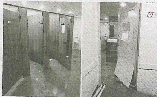
Gambar keadaan tandas lelaki di bahagian kecemasan HTJ yang dikongsi pemilik akaun Facebook Guna Vimala.

Perkongsian tersebut turut mendedapat pelbagai reaksi netizen yang kesal