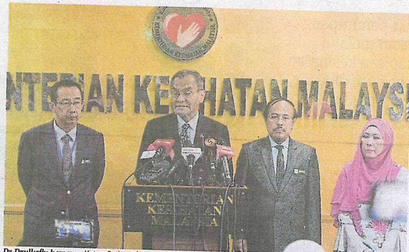
Dr Dzulkefly bersama Ketua Setiausaha Kementerian Kesihatan, Datuk Seri Dr Chen Chaw Min (kiri) pada sidang media di Kementerian Kesihatan, Putrajaya, semalam.

Dzulkefly berkata, kontak positif coronavirus kes 32 orang dan lima