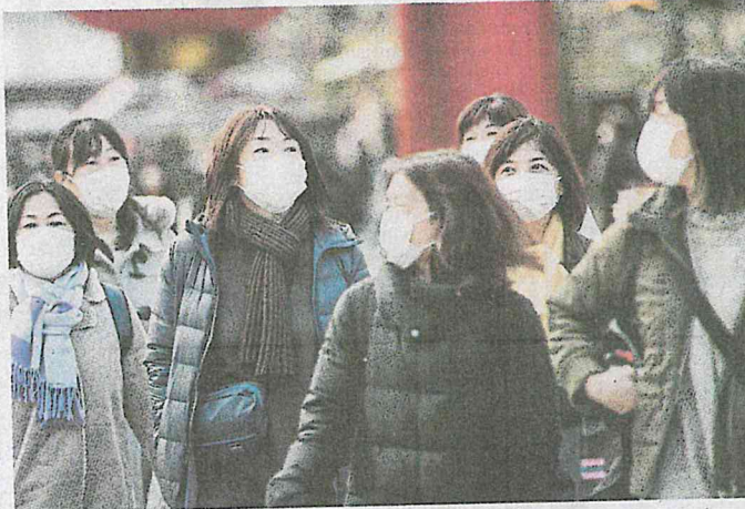
TOPENG muka dan pencuci tangan kini mendapat permintaan tinggi.

Menurutnya, syarikat pembekal dan peniaga di beberapa negara seperti Jepun sudah mengedarkan topeng muka secara percuma sebagai tanggungjawab sosial korporat (CSR) kepada komuniti setempat.