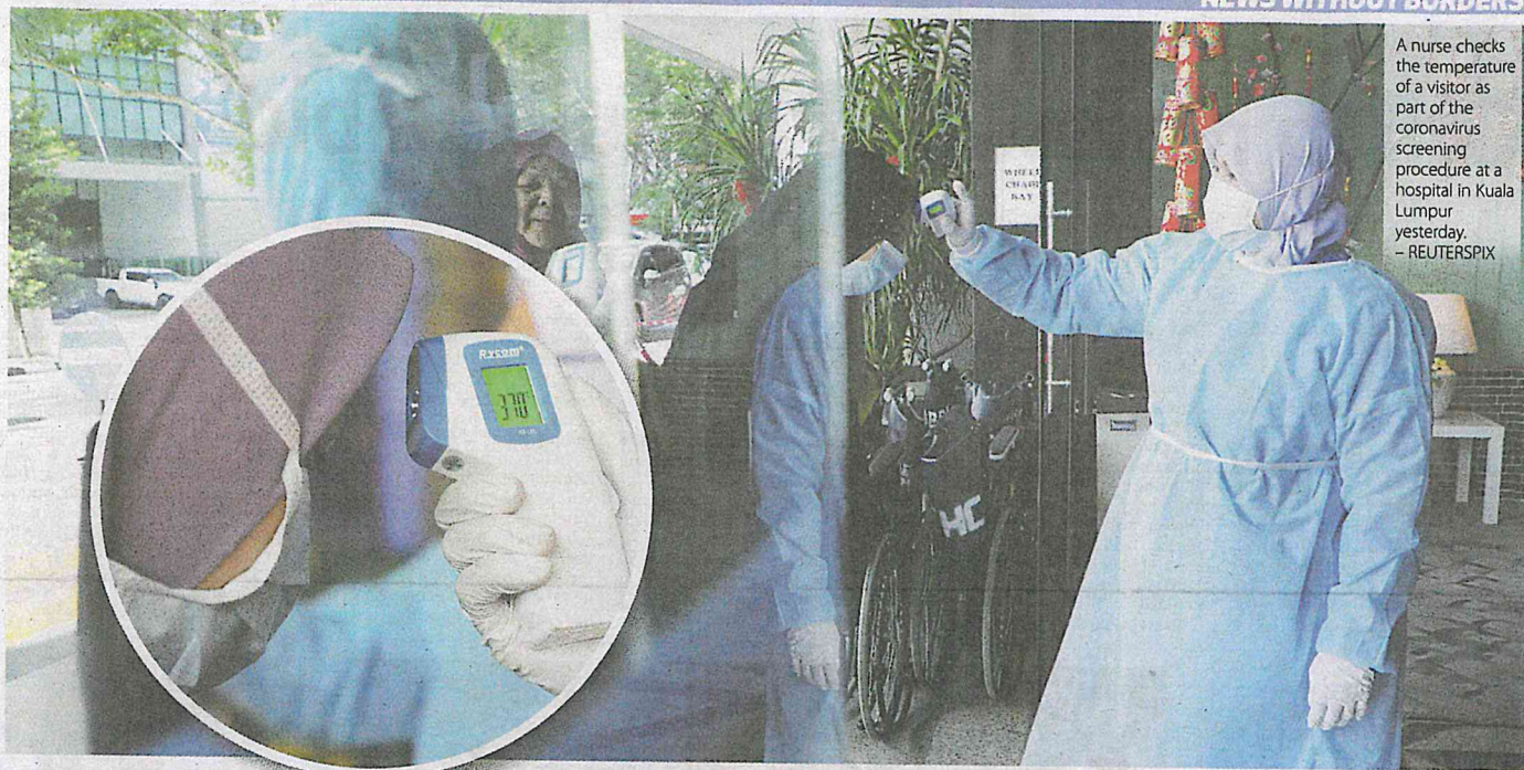
A nurse checks the temperature of a visitor as part of the coronavirus screening procedure at a hospital in Kuala Lumpur yesterday.