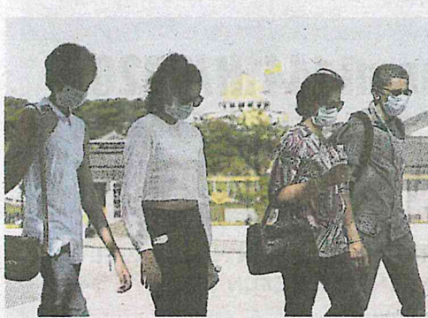
PELANCONG memakai topeng muka di sekitar Istana Negara, semalam.