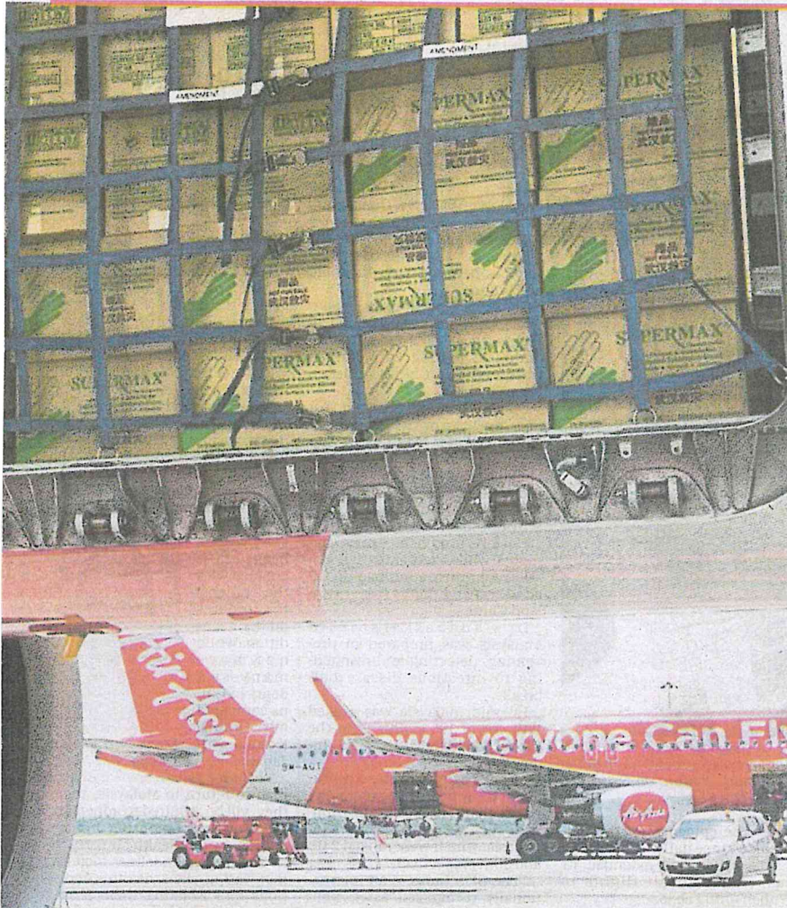
AirAsia Flight AK8264 with the 500,000 pairs of rubber gloves given by Malaysia to China at klia2 in Sepang yesterday.